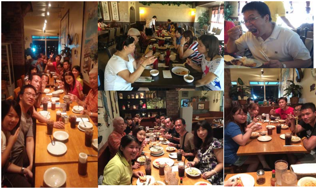
耗盡了體力~要給他好好補補