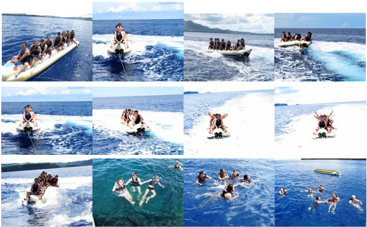
驚濤駭浪、捲起千堆雪．．．．．刺激!!