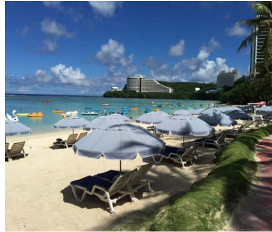
藍天、白雲、陽光、沙灘.....我們來也